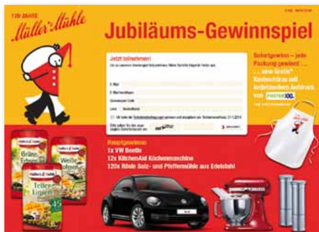
Landingpage 120 Jahre Müller's Mühle

Die foodlounge entwickelte die gesamte Konzeption einschließlich Kreation aller Medien, Programmierung Landingpage, Versicherungsleistung, Clearing und kontinuierlichem Reporting der Rücklaufquoten.