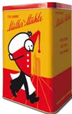
Key-Visual Müller-männchen, Nostalgie-dose, Jutebeutel