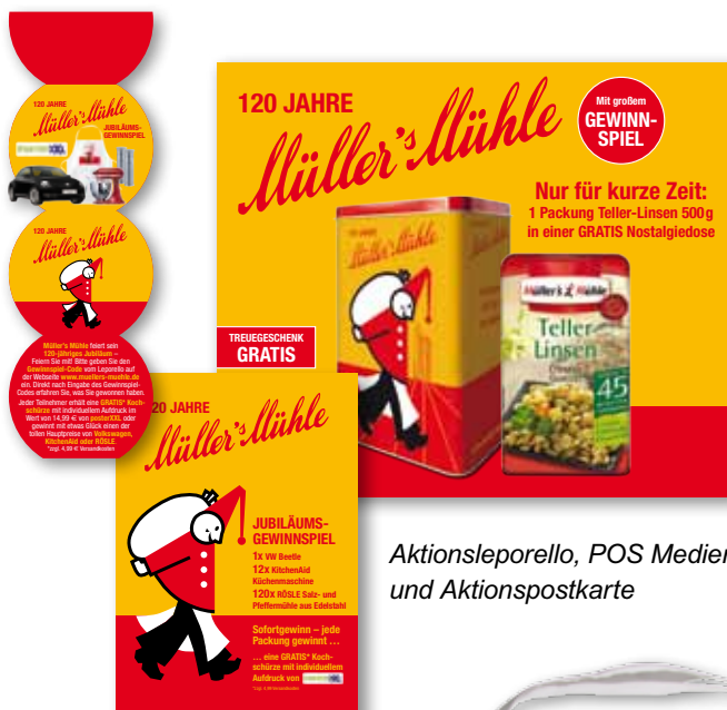
Aktionsleprello, POS Medien und Aktionspostkarte

Das Jubiläums-Key-Visual fungierte im Rahmen der Promotion auf allen Werbe- und Promotionmedien als Eye-Catcher und traditionell anmutende Impulsfigur. Die Figur symbolisiert dabei die Werte des Unternehmens wie Zuverlässigkeit, Freundlichkeit, Motivation und Fairness als Grundpfeiler unternehmerischen Handelns. Sowohl auf den Nostalgie-Sammelkarten, die im Rahmen von Zweitplatzierungen eingesetzt wurden, als auch auf der Jubiläumspromotion selbst bietet das Müller-männchen eine einheitliche und wiedererkennbare Klammer.